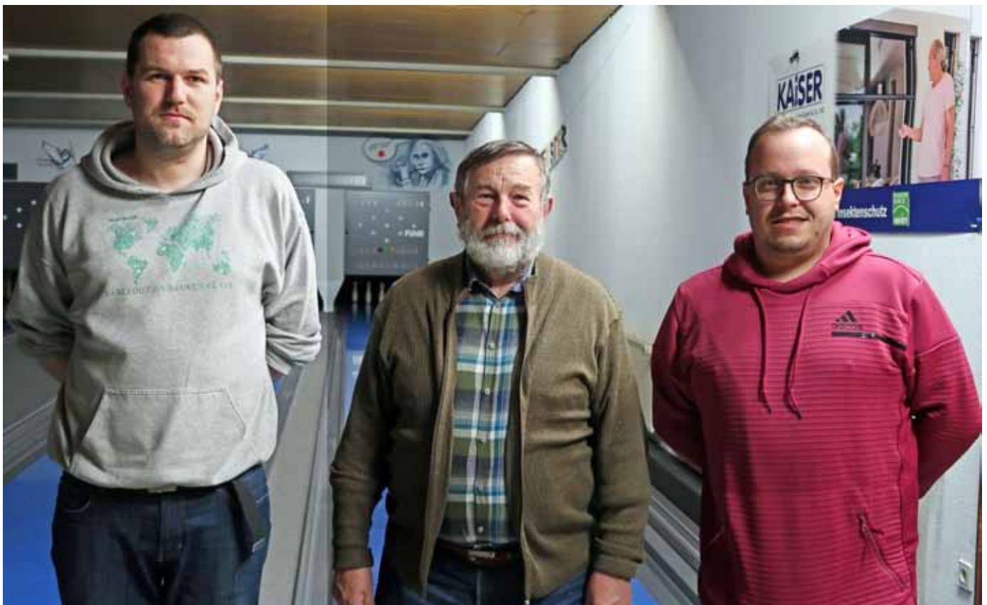
Drei geschätzte und erfahrene WKBV-Funktionäre, die ab sofort den Arbeitskreis Satzung und Ordnungen (ASO) bilden.

Die Streichung des Verbandsjugendwartes führte zu einer längeren Diskussion. Da die Jugend autark ist, muss sie auch in der Satzung aufgeführt werden. Das Problem könnte gelöst werden, wenn der WKBV einen Vizepräsidenten Classic Jugend und einen Vizepräsidenten Bowling Jugend wählt. Eine Entscheidung wurde noch nicht getroffen. Text und Bild: hibu