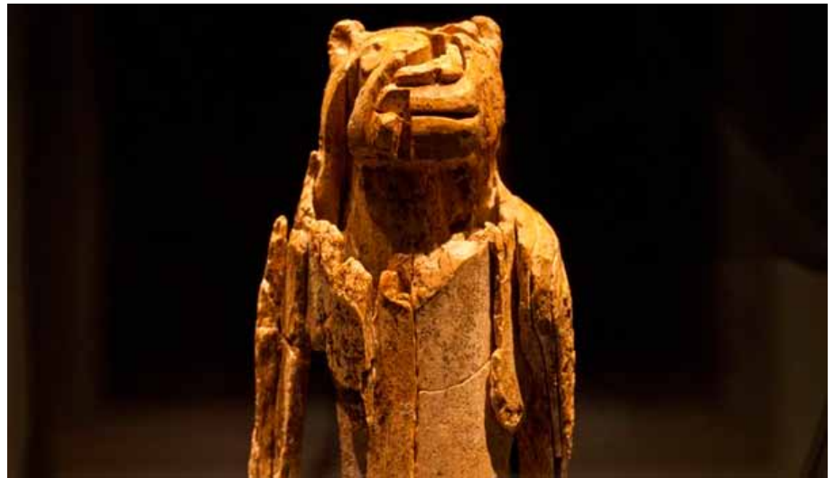
Der Löwenmensch, der im Museum Ulm steht, ist die größte und geheimnisvollste der Eiszeit-Skulpturen.

Während der Altsteinzeit gab es Löwen auf der Schwäbischen Alb. Doch wie kamen die Menschen dazu, die Züge des Tieres mit denen eines Menschen zu vermischen? Welche Bedeutung kam der Figur zu? Es liegt die Vermutung nahe, dass sie ein