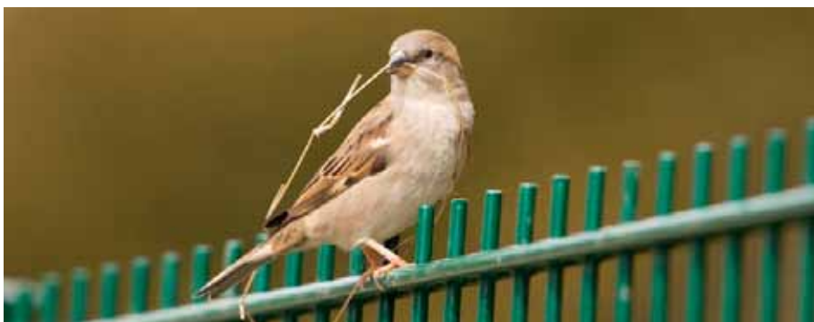
Der Ulmer Spatz.

Es war einmal in der freien Reichsstadt Ulm eine stolze Bürgerschaft, die wollte ein Münster bauen. Schön und hoch sollte die Kirche werden. Um das Dach zu stützen, benötigte der Baumeister lange Holzbalken. Er sandte seine Gehilfen aus der Stadt, um kräftiges Holz herbeizuholen. Und so machten sich diese auf den Weg. Frohen Mutes schafften die Gehilfen Baumstämme herbei und stapelten sie quer auf einen Wagen. Wie sie damit nun die Stadtmauer passieren wollten, zeigte sich, dass das Tor in der Mauer viel zu schmal war.