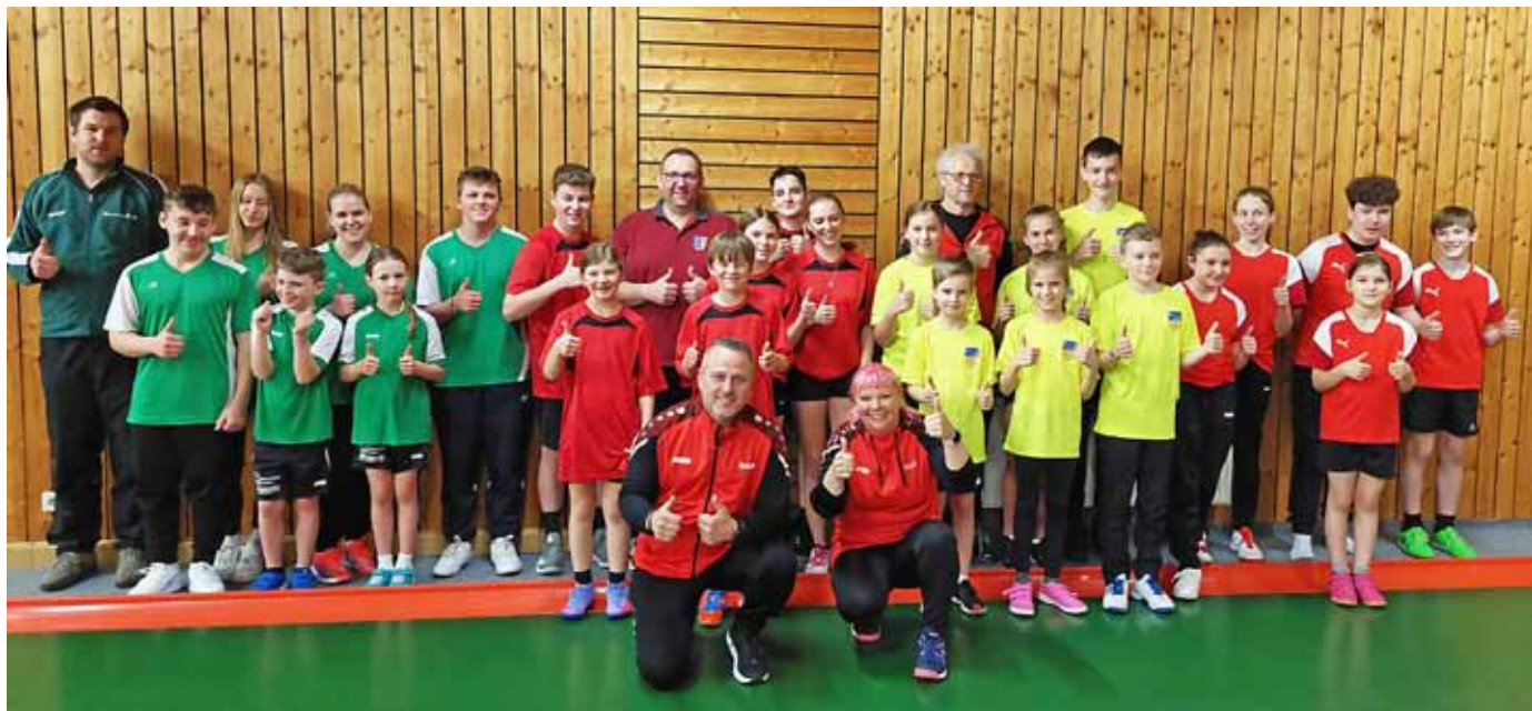
Hier war Spaß und Freude am Sport bei allen angesagt.