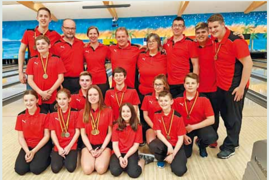
Das gesamte Team Württemberg mit seinen Trainern und Betreuern.

Nun das heiß umkämpfte Feld der 25 Doppel der männlichen A-Jugend: Hier starteten unse-