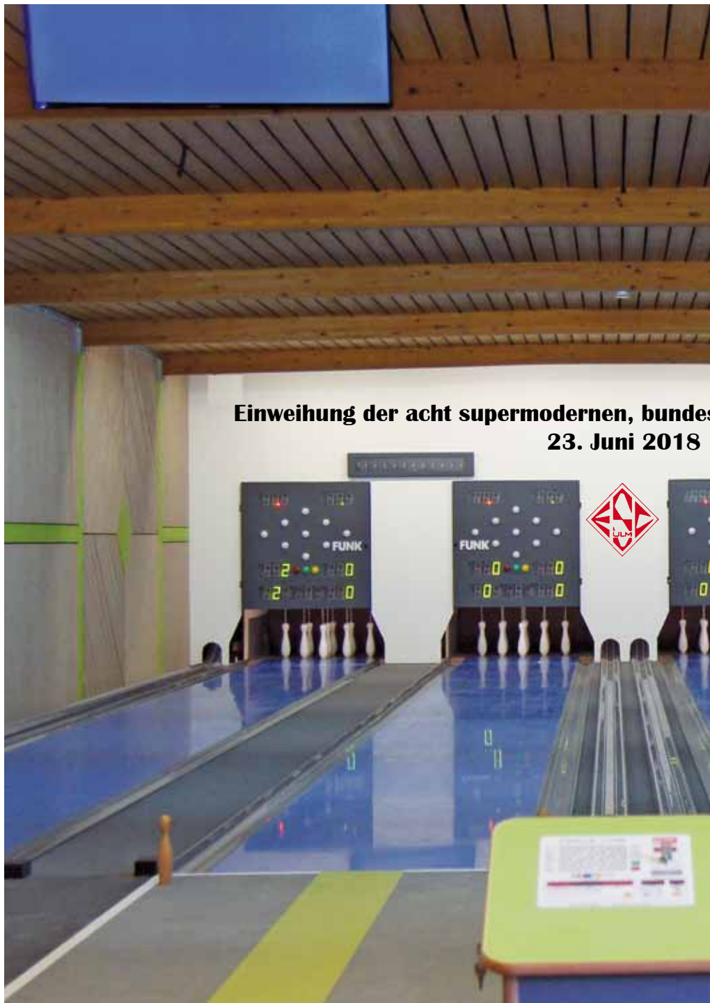
Einweihung der acht supermodernen, bundesweit 23. Juni 2018

Bei der feierlichen Einweihung der neuen Anlage dankte der Vorsitzende des Eisenbahn-Sport-Clubs Ulm, Halim Aydin , dem WLSB und