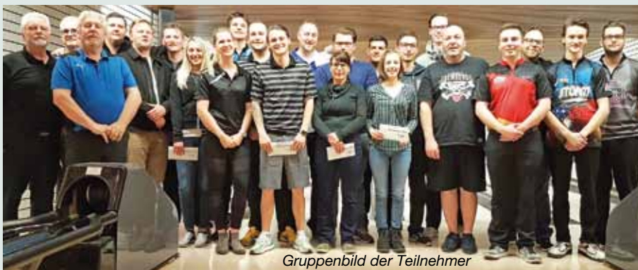
Gruppenbild der Teilnehmer