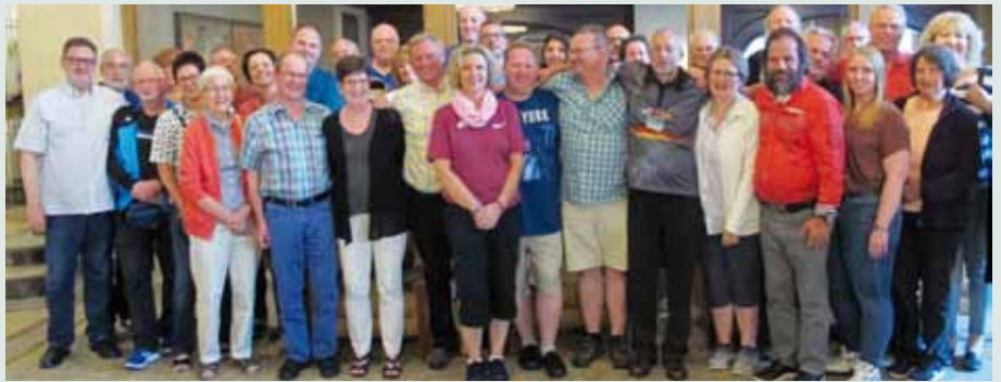
Gruppenbild vom USBC-Open.

Einen Tag nach unserer Ankunft in Syracuse begann der Teamwettbewerb. Die Bowlingbälle wurden gecheckt, dann ging es in den „Squad-room“, in dem alle Stuhlreihen mit Bahnnummern versehen sind und man begibt sich auf die Platzreihe mit seiner Bahnnummer. Die Aufregung erhöht sich nun schon, vor allem für Teilnehmer, die das erste Mal dabei sind. Es folgten Ansprachen über die Regeln, die bei diesem Turnier gelten und es gab Ehrungen von Teilnehmern, die z.B. schon das 20. Mal dabei waren. Nach diesen Ansprachen ging man gemeinsam, Reihe für Reihe, mit seinem Bowlingequipment auf die Bahnen. Jetzt wurde es feierlich, denn für uns Ausländer wurden die Nationalhymnen gespielt. Am Schluss folgt die amerikanische Nationalhymne.