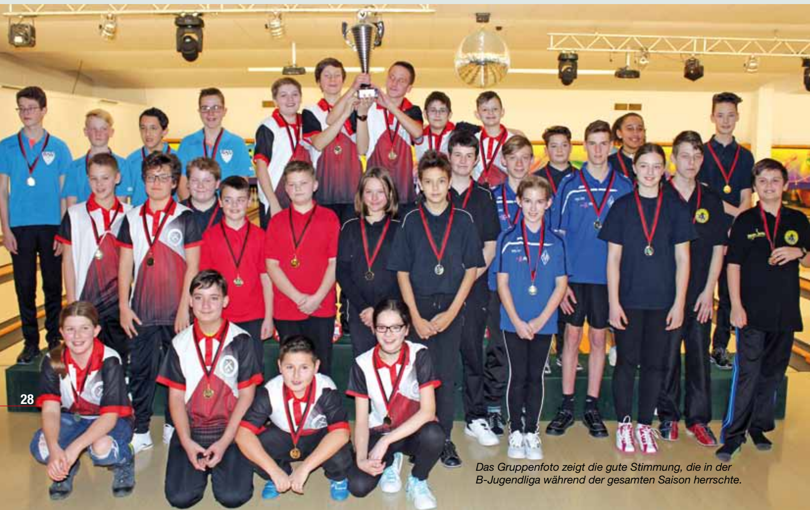
Das Gruppenfoto zeigt die gute Stimmung, die in der B-Jugendliga während der gesamten Saison herrschte.